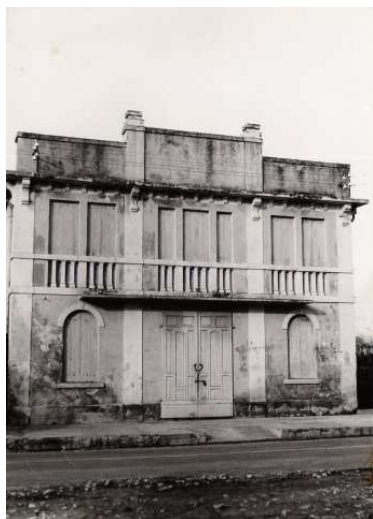
1926 (foto A. e C. Giacomello)

Tratto da: Francesco Rando, Sulle rive dell'Astico , - storia di Chiuppano e dell'Alto vicentino, Chiuppano, 1958